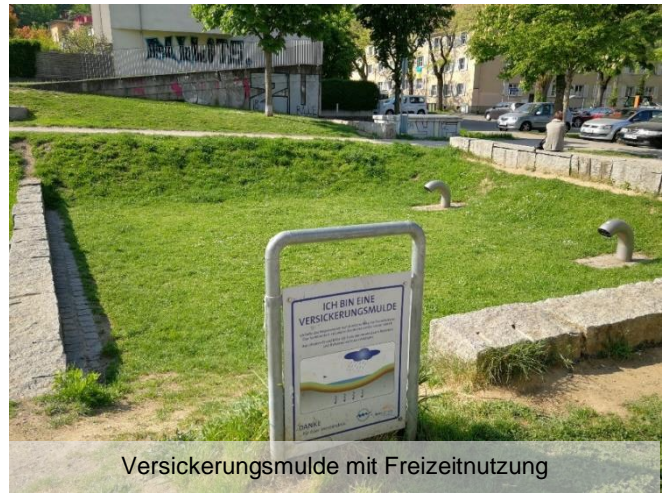
Versickerungsmulde mit Freizeitnutzung

Stadthalle Singen Hohgarten 4, 78224 Singen (Hohentwiel)